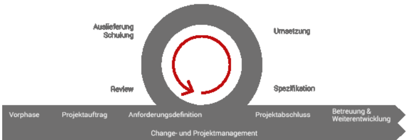
Abbildung: Projektvorgehen nach itd SIM

Die wiederkehrenden Bausteine der itd SIM sind die Schritte, die wir in jedem einzelnen Projektzyklus für Ihr aktuelles Anforderungspaket umsetzen. Durch diese Vorgehensweise können Sie am Ende jedes Zyklus Ihr Feedback und veränderte Anforderungen einbringen. Gleichzeitig ermöglichen die kurzen Projektzyklen eine schnelle Auslieferung kleiner Softwarepakete und damit ein schnelles produktives Arbeiten mit eben diesen. Ihr Vorteil: Sie haben direkten Einfluss auf den Ablauf des Projekts und maximale Transparenz über Aufwand und Kosten.